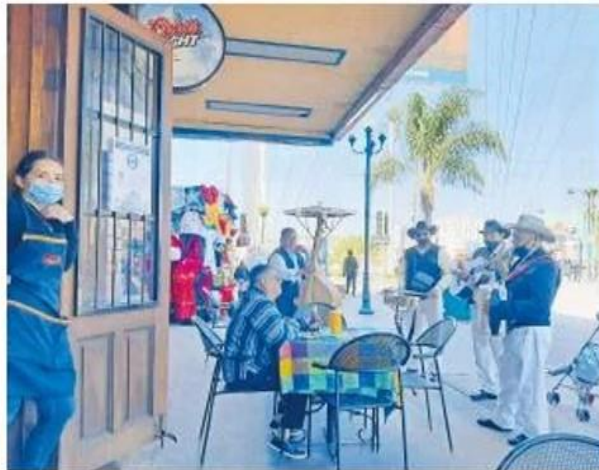
Además de la reapertura de bares y salones, habrá nuevos aforos para gimnasios, centros deportivos, centros de masajes, albercas, cines, teatros y eventos culturales