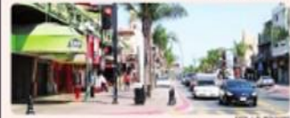
TIJUANA.- Con el cambio de semáforo a color amarillo, se reanudarán actividades como albercas, balnearios, salones de eventos y bares a partir del próximo lunes.