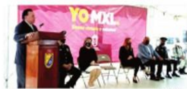
MEXICALI.- El fiscal señaló que Mexicali sigue siendo la ciudad más segura de Baja California, gracias al trabajo de la alcaldesa.